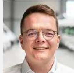
Jonas Gerten Verkauf Reisemobile

☎ 02871 95 72 - 222 ☎ 02871 95 72 - 235 ✉ rj@cc-bocholt.de